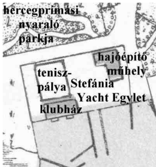
A fürdőtelep 1900-as térképének részlete, a Stefánia Yacht Egylet teniszpályájának utólag berajzolt helyével

Balatonfüred is lassan megváltozott: egyre inkább előtérbe került a gyógyászati jellege, a társasági élet az 1890-es évek elejétől áttevéődött a Balaton déli partján sorra megalakuló új fürdőhelyekre, az 1896-ban átadott balatonföldvárin például két teniszpálya is nyílt. A Stefánia Yacht Club udvarán levő teniszpályát a századfordulót követően csónakok és vitorlások tárolására használták.