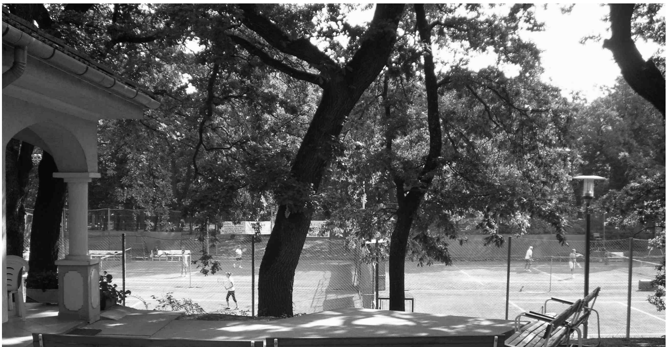
A teniszpályák 2013 júliusában