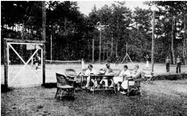
Életkép a kiserdei teniszpályánál, az 1930-as évek közepén 61

zas lüktető élet megcsitult, bár a fiatalság mindinkább növekvőben van Füreden. ... A tenniszezés már meg is kezdődött, dacára a hüvös időnek és hisszük, hogy a nyáron újra kivirágzik a környéken is nevéssé vált klubélet.” 60