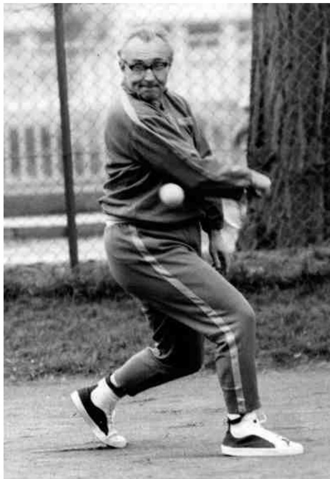
Horváth professzor akcióban 85

Vad Dezső, az 1948-as év wimbledoni junior kategória győztese (2010-ig ő volt az egyetlen magyar wimbledoni győztes) is megfordult. A sportolókon kívül a politikai és kulturális élet prominens képviselői is ellátogattak ide. 84